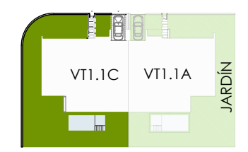
SUP. TOTAL PARCELA PRIVADA: 492.30 m 2